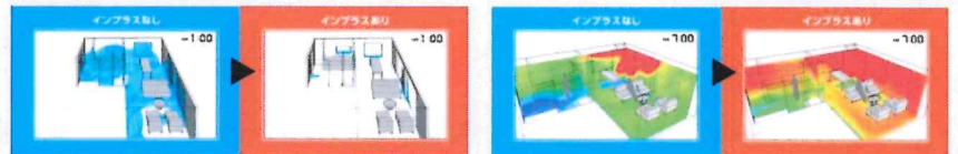
【寒い冬の夜】窓からの冷気の広がりの違い